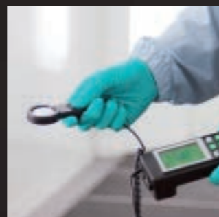
Misurazione della luminosità nella cabina di verniciatura.